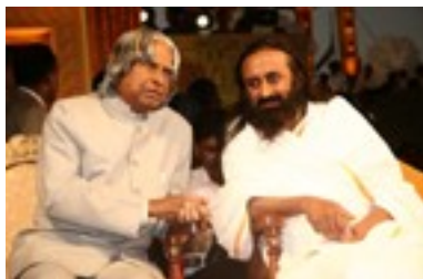
Il Presidente dell'India e Sri Sri Ravi Shankar al Meeting Internazionale di Bangalore, febbraio 2006.