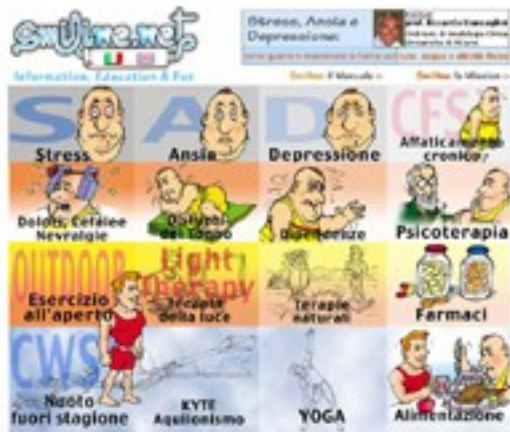
Homepage del sito www.smiline.net

A fronte delle esperienze molteplici, educative e clinico-pratiche, egli ha acquisito competenze specifiche in ambito psichiatrico e psicoterapeutico che sono documentate nei siti internet www.smiline.net e www.joyofliving.net , il cui contenuto scientifico è stato elaborato con la collaborazione di autorevoli esponenti del mondo scientifico internazionale.