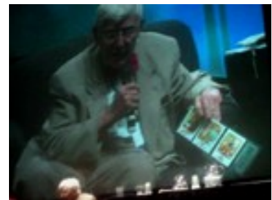
11 Dicembre 2005, Anaheim (Los Angeles) Aaron Beck esperto mondiale di Depressione e fondatore della Terapia Cognitiva presenta le carte di Ciancaglini come strategia di supporto ed esempio di “ positive psychology ” per il trattamento della depressione.

Incoraggiato dall'ampio e autorevole apprezzamento egli fonda la Smiline Card Academy per l'abilitazione all'utilizzo terapeutico delle carte in ambito psicoterapeutico, pedagogico e preventivo educativo.